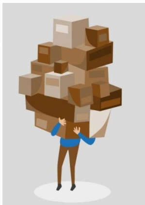
Armstark HSOK:are med leverans till Kiosk nr 3

Vid den 3:e etappen i Friseboda hände det som inte får hända. Bränslet, till fordonen med uppgift att transporterar ut varor till kioskerna, tog slut. Soppatorsk helt enkelt! Vad göra! Jo, ett antal armstarka HSOK:are ryckte ut till fots och bar hem varor till kiosken. Det är så vi i HSOK jobbar, vi ser möjligheterna inte hindren!