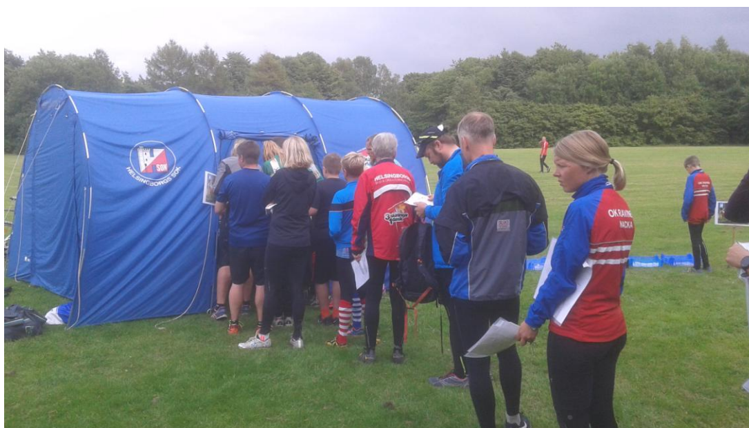
Bilder Macke S