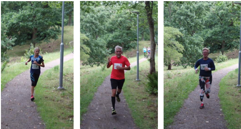
Bilder Macke S

136 löpare kom till start och av efterföljande kommentarer hördes enbart positiva omdömen om arrangemanget och terrängbanan som sådan.