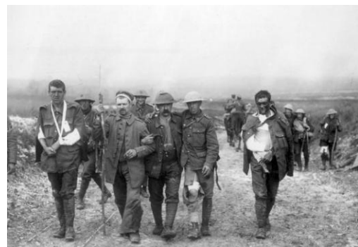
Sårade soldater lämnar fronten