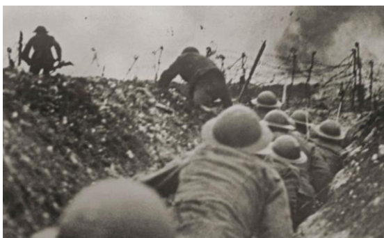
Soldater i skyttegrav

Året efter slöts ett fredsavtal, Versaillesfreden, mellan västmakterna och Tyskland. Avtalet undertecknades på slottet Versailles utanför Paris den 28 juni 1919.