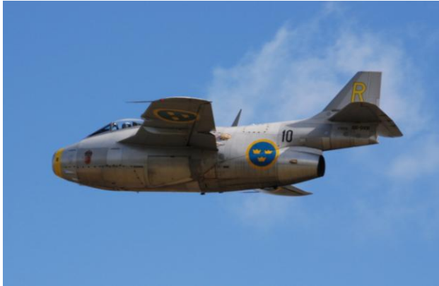
Bild till vänster: SAAB J29 F "Flygande Tunnan" den i dag enda flygande 29:an. Flygplanet benämns ofta som "Gul Rudolf".

För 70 år sedan, närmare bestämt den 1 september 1948, flög SAAB J29 för första gången. Från det att vi i Sverige sedan andra världskrigets början varit isolerade från den flygtekniska utvecklingen i omvärlden till att efter krigsslutet kunde ta jättekiv framåt med J29:an och passera både England och Frankrike utvecklingsmässigt med flera år är respektingivande. Förklaringen låg framförallt i tillämpningen pilformade vingar som var ett epokgörande aerodynamiskt framsteg i farthöjande syfte.