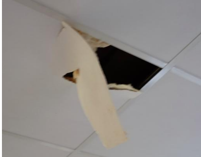
Innertak i samlingslokalen

Helsingborgs stads skyddsjägare tillkallades och ”tog hand” om mårdarna. Sanering har utförts av ett företag med specialkunskaper i ämnet. Vidare har defekta takplattor bytts ut.